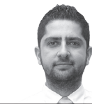
ΔΡ. ΒΕΛΙΣΣΑΡΙΟΣ ΔΗΜΗΤΡΙΟΥ MUSKITA Aluminium Industries