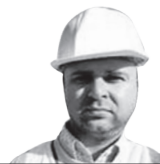
ΓΙΑΝΝΗΣ ΠΕΡΙΚΛΕΟΥΣ A.J. Pericleous L.L.C.